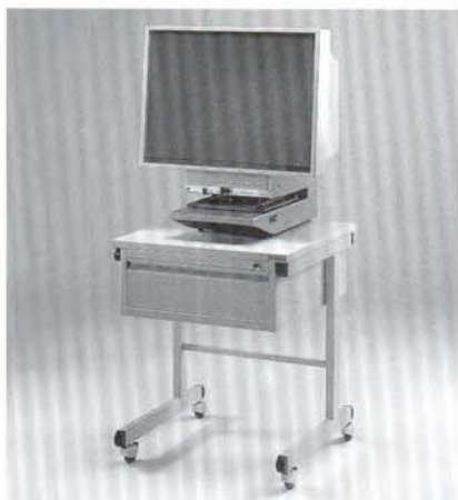
Lesegerät CL 2 und CL 3 auf Rolltischen Systematic 5100 Readers CL 2 and CL 3 on roll-tables Systematic 5100